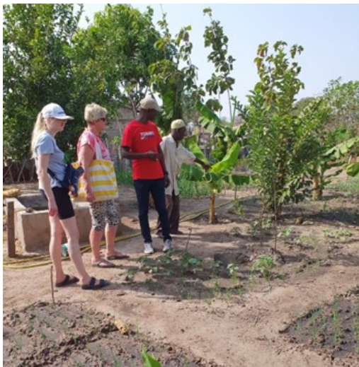
INDKØB AF TRÆER TIL UDPLANTNING.

På IT-centeret bag ved skolen, hvor der er tilsluttet vand, er der et stor